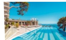
Hotel TUI BLUE Jadran

Urlaub im Bio-Hotel Eggenberger im Allgäu im Wert von 4.000 €