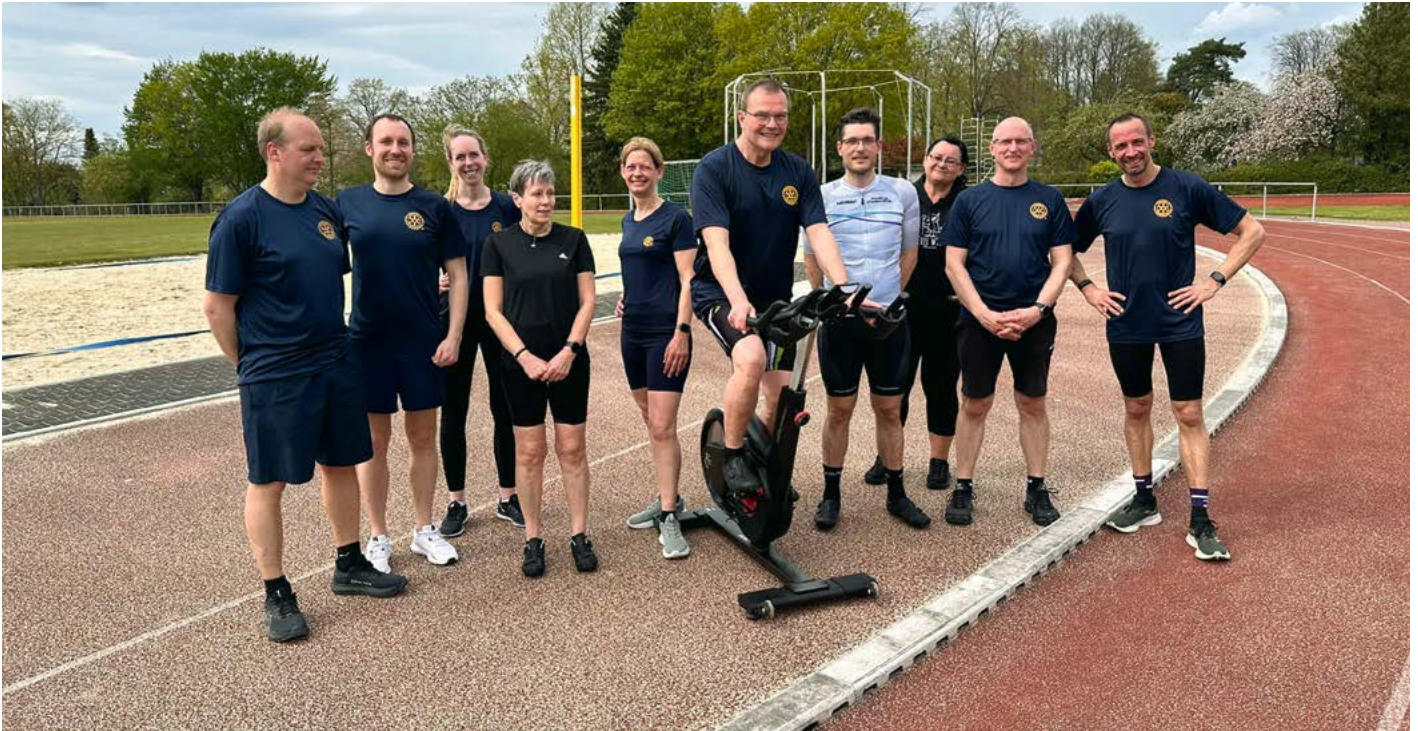
Die Teilnehmenden der Schlussrunde

In 32 Fahrten legten Mitglieder des Rotary-Clubs Nienburg-Neustadt am 18. April 464,7 fiktive Kilometer auf Indoorcycling-Bikes zurück. Sie verbrannten dabei 9.157 kCal und vergossen viel Schweiß.