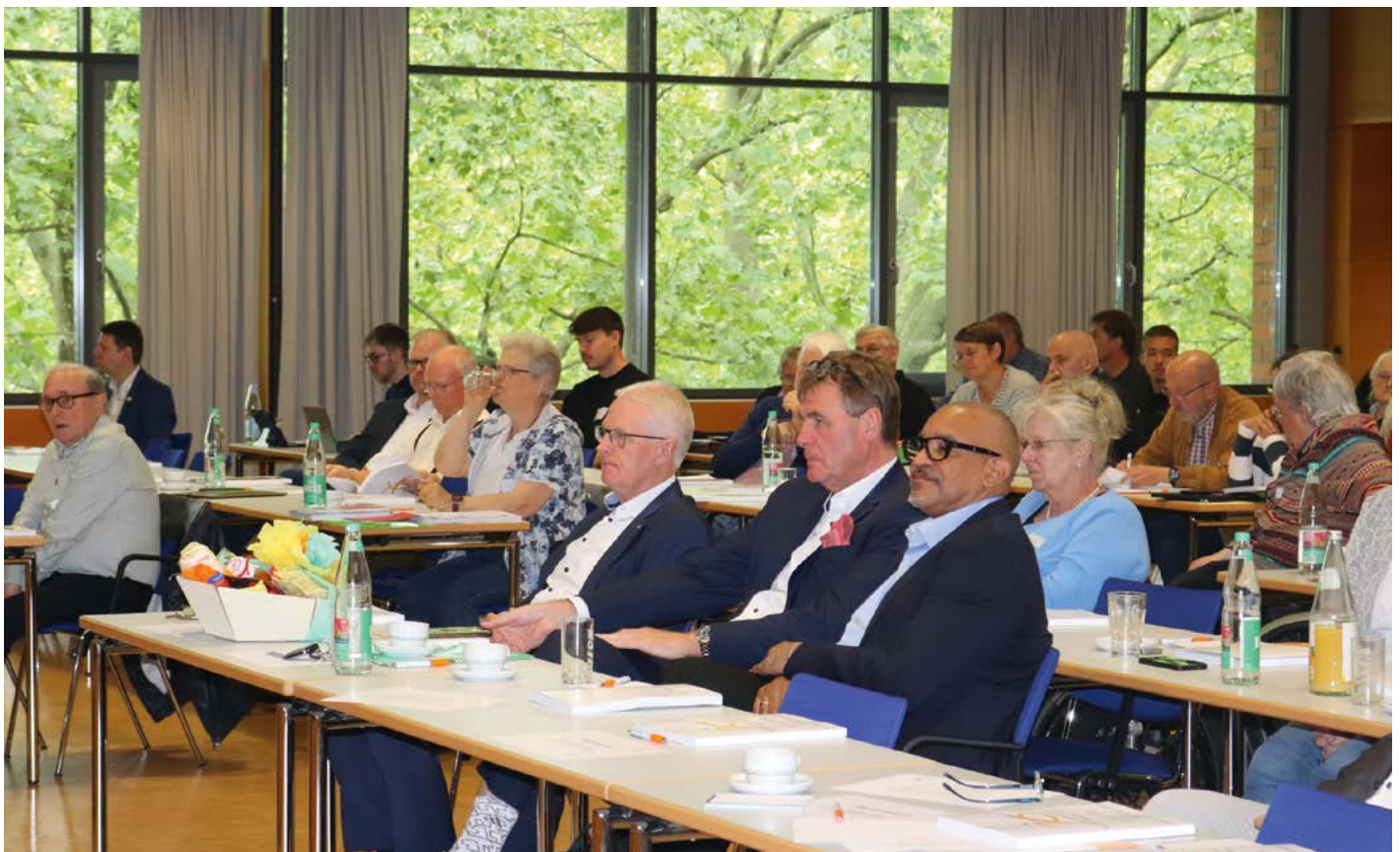
Volles Haus beim 25. Verbandstag des BSN und volle Aufmerksamkeit für ein volles Programm

Die Delegierten des Behinderten- und Rehabilitationssportverbandes Niedersachsen – so sein neuer Name – (BSN) haben auf dem 25. Ordentlichen Verbandstag wichtige Entscheidungen für die zukünftige Entwicklung des Verbands getroffen. Beschlossen wurden eine Neufassung der Satzung, personelle Weichenstellungen sowie die zukunftsweisende Stärkung von Teilhabe und Inklusion im Sport.