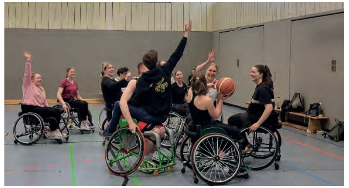
... macht sichtbar Spaß