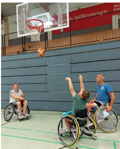
Jugend-Rollstuhlbasketball-Training bei Blau-Weiss Buchholz

Sie freuen sich bereits heute auf das Heiner-Rust-Masters am 18. November und hoffen, dass alle drei Nachwuchstalente dann auch mitkommen können: „Das erste Rollstuhlbasketball-Turnier wird bestimmt ein großes Erlebnis für sie werden!“