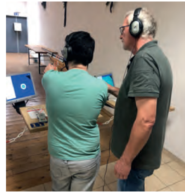
Wöchentlich was los in der Schießsportgruppe