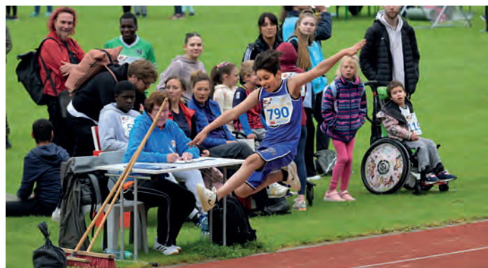
Kleine Leute, große Sprünge