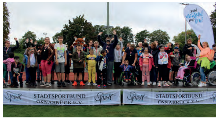
Großer Jubel bei der Siegerehrung, Foto: Heiko Brüning / Udo Schulz