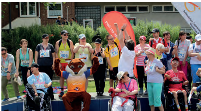
Niemand ging bei der Medaillenverleihung leer aus, Foto: BSN