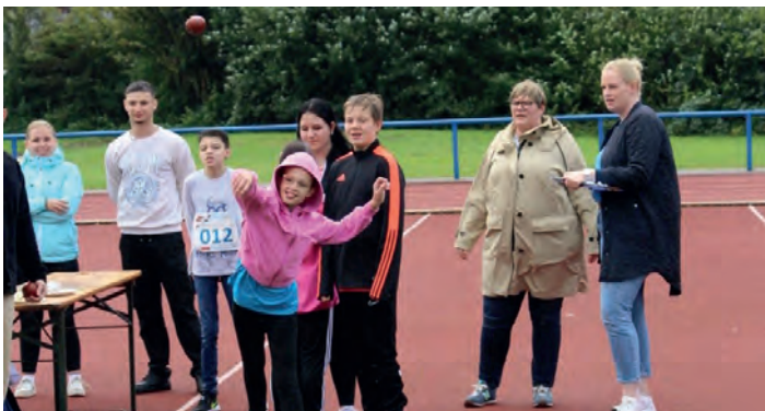
Volle Konzentration beim Wurf.