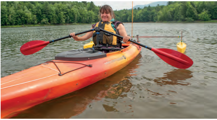
Das Kajak bietet einen speziellen Ausleger und eine Paddelstütze für Sportler*innen mit Behinderungen