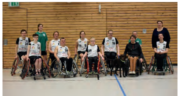
Der hoffnungsvolle Nachwuchs

Seit 2018 unterstützt die Heiner-Rust-Stiftung des BSN das Projekt der Nachwuchsförderung im Rollstuhlbasketball im Rollstuhl-Sport-Club (RSC) Osnabrück. Vor 2018 war die Jugendarbeit des Vereins nach eigenem Bekunden „eher Glücksache“. Dank der Hilfe der Heiner-Rust-Stiftung war es möglich, Anfängerstühle zu beschaffen, die sowohl im Trainingsbetrieb von Kindern genutzt werden können als auch beim RSC-Schulprojekt zum Einsatz kommen. 2018/2019 gelang es dank der Förderung, das Schulprojekt „Das Rollende Klassenzimmer“ ins Leben zu rufen, das bereits im Gründungsjahr durch zehn verschiedene Schulen im Stadt- und Landkreis Osnabrück rollte. – Über 20 Klassen und Gruppen profitierten von der neuen Erfahrung Rollstuhlbasketball. Auch im zweiten Jahr blieb die Nachfrage weiterhin stark, sodass in den ersten Monaten drei weitere Termine durchgeführt werden konnten. Aufgrund der Corona-Pandemie mussten die bereits geplanten Termine ab Mitte März leider auf unbestimmte Zeit verschoben werden. Auch die Anfragen für Schulsportfeste, die Teilnahme an der „Bewegten Woche“ in Osnabrück und Ostfriesland sowie die Teilnahme am Ferienpassprogramm der Stadt Osnabrück waren daher leider nicht möglich. Auch das zweite Standbein der RSC-Nachwuchsarbeit, die wöchentliche Trainingseinheit für Kinder und Jugendliche, hat unter der Coronazeit gelitten. Der Verein hatte 2020 extra eine