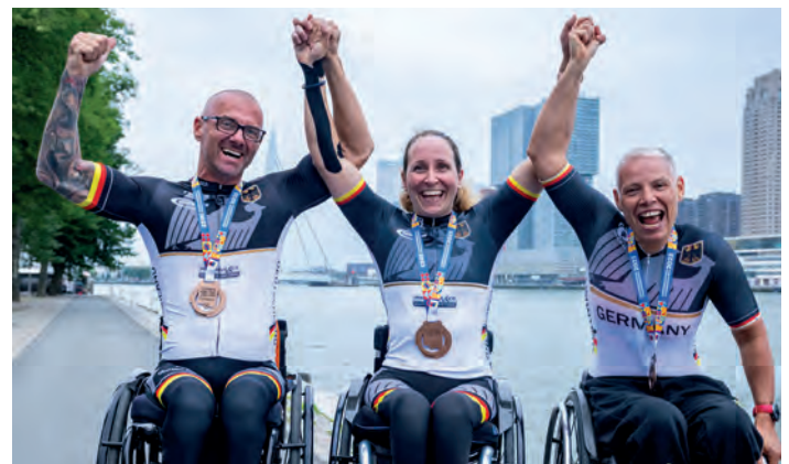
Siegerehrung der Staffel