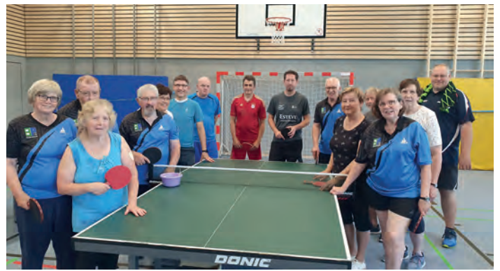
Ping Pong Parkinson hat hier viele Fans, Foto: InduS, Kreissportbund Emsland