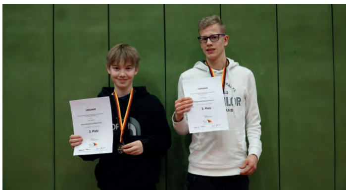
Zwei stolze Zweitplatzierte