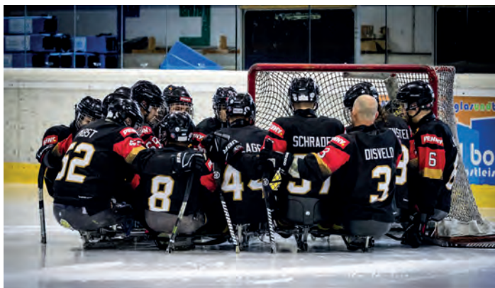
Die Para Eishockey-Nationalmannschaft