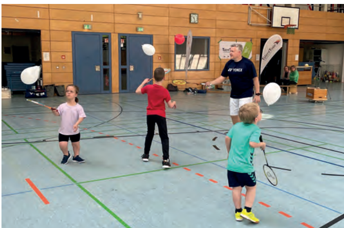
Höchste Konzentration beim Training

https://www.bsn-ev.de/sport/leistungssport/talenttag/