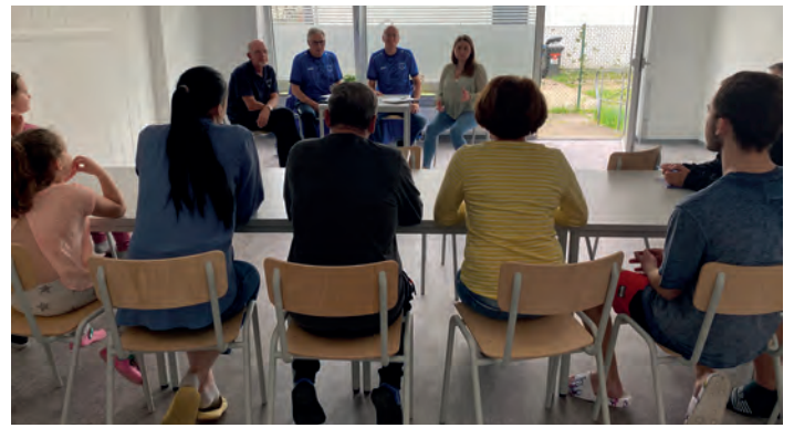
Bei einem ersten Treffen kam man sich schnell näher