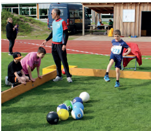
Fußball-Billard, eine Attraktion