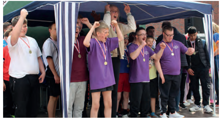
Grenzenloser Jubel bei der Siegerehrung